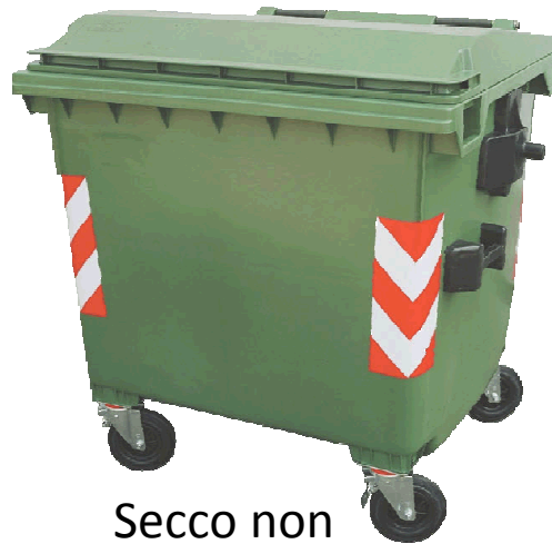
Secco non riciclabile